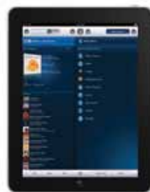
iPad Sonos Controller