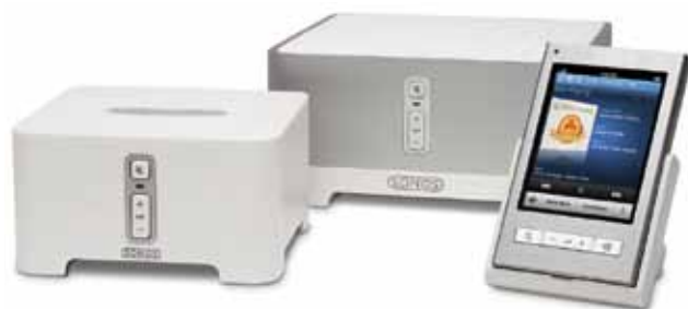
Zestaw Sonos Bundle 250